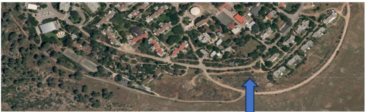
מיקום שכונת הקראווילות

באסיפה הבאה, שתתקיים ביום ראשון, י"ב באלול, 15.9 – נציג בפני החברים עת פרטי התוכנית של שכונת הקראווילות. כפי שפורסם בעבר, נענינו לבקשת המועצה ואישרנו הקמת עשר קראווילות, בגודל 90 מ"ר, בשטח שמיועד בעתיד לשכונה חדשה, ליד שכונת "יבניאל". המשפחות שיגורו במתחם, תהיינה משפחות של עובדי מרכז השיקום החדש, שנפתח בימים אלה בבית החולים "צפון" (פוריה). ועדת קבלה משותפת לקיבוץ, למועצה ולבית החולים, תהיה אחראית על קבלת המשפחות ועל סיום החוזה איתן במידת הצורך. לצורך הקמת המתחם, תישא החטיבה להתיישבות בעלויות פיתוח האזור, כולל תשתיות שתשמשנה את הקיבוץ בהמשך, עת יבנו שם בתי חברים. ההסכם של הקיבוץ הוא לעשר השנים הקרובות, לאחרים נוכל לרכוש את הקראווילות או לפנות אותן. באסיפה זו ישתתפו נציגי המועצה, החטיבה להתיישבות ובית החולים, יוצגו כל הפרטים בפני החברים והפרויקט כולו יובא לאישור האסיפה.